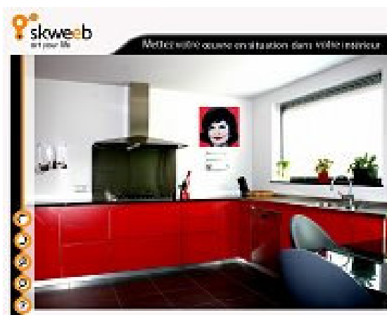
Mise en situation chez soi d'une œuvre

Enfin, Skweeb travaille pour que public et artistes communiquent et se découvrent mieux. En ce sens, les contacts avec les artistes sont libres et gratuits : chaque page artiste comporte ainsi adresse postale, numéro de téléphone, site perso et adresse email (protégé du spamming par un formulaire).